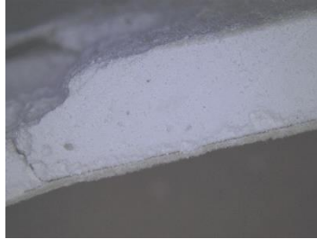
【実体顕微鏡写真（石膏ボード）】